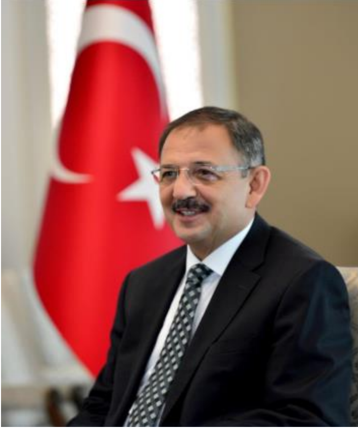
Mehmet ÖZHASEKİ Çevre, Şehircilik ve İklim Değişikliği Bakanı

Biriktirmiş olduğu tecrübesiyle ülkemizin en köklü kurumlarından olan Tapu ve Kadastro Genel Müdürlüğümüz taşınmazlara ilişkin mülkiyet bilgilerini devlet güvencesi altında muhafaza etme, güncelleme, taşınmazlara yönelik politikalar belirleme ve yönetme konularında çok yakın geçmişte pek çok öncü ve önemli projeyi hayata geçirerek örnek bir kurum olduğunu ortaya koymuştur.